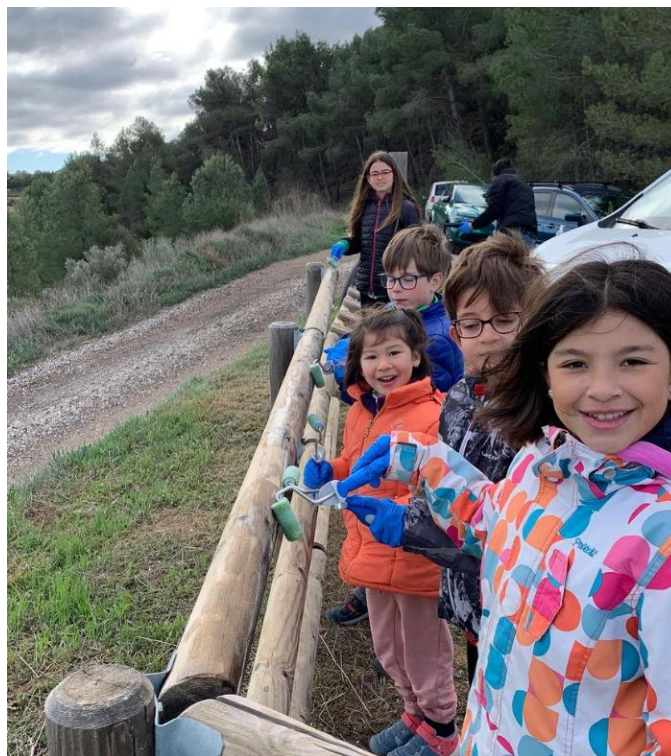
Imatge 2. Promoció del voluntariat des de ben petits. Jornada de restauració d'un espai a la Pobla de Massaluca.