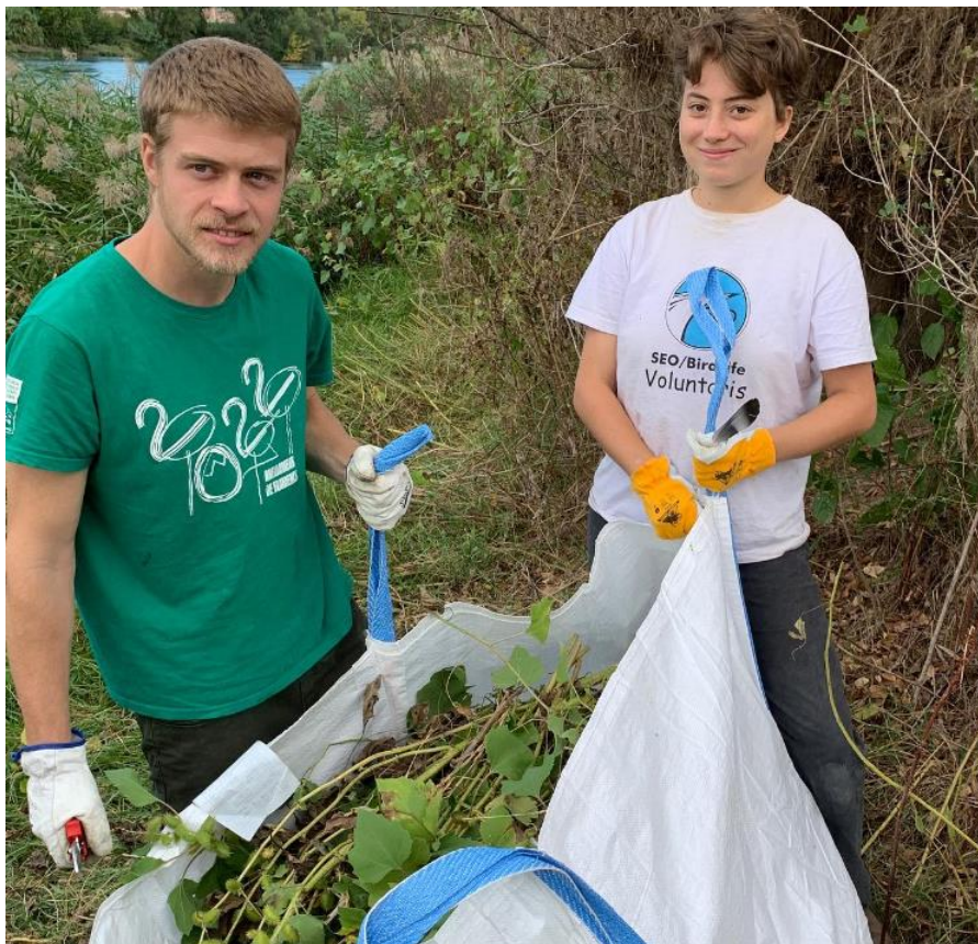
Imatge 6. Voluntariat internacional participant en la retira d'espècies exòtiques a les illes de Móra d'Ebre.