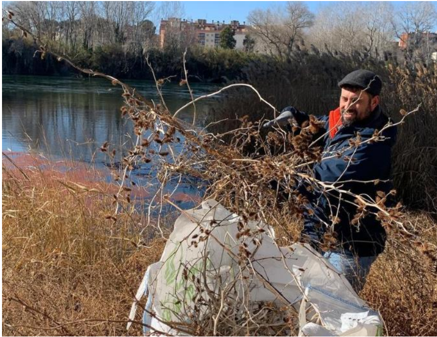
Imatge 5. Retirada de Xanthium echinatum (EEI) a Móra la Nova.