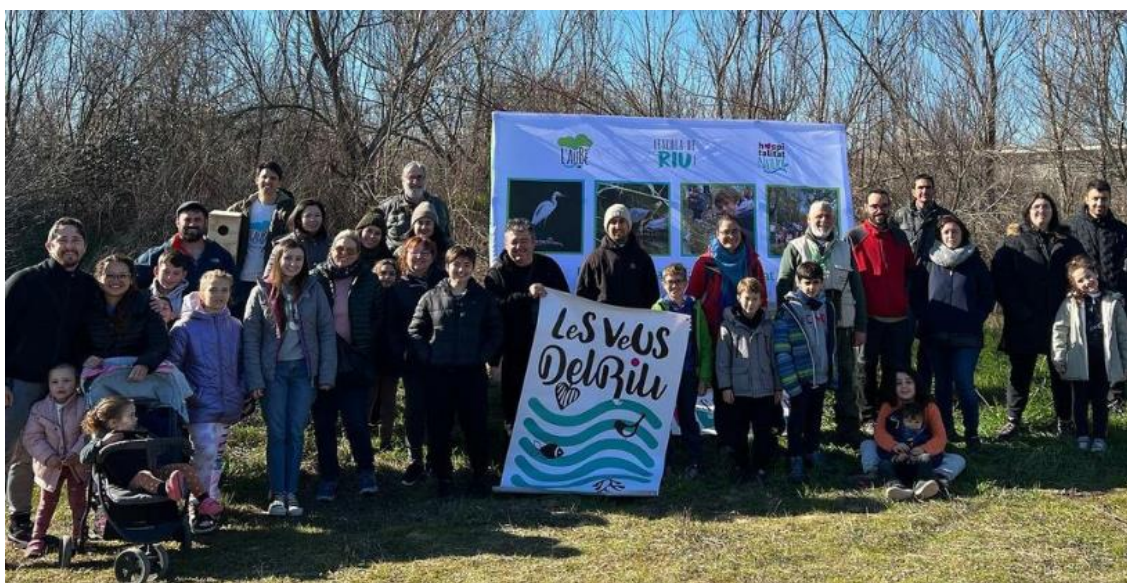
Imatge 1. Grup de voluntaris en una jornada de voluntariat a Móra la Nova.

D'altra banda, les jornades de voluntariat que organitzem des de l'entitat, no sempre són jornades d'actuació sobre l'entorn. Organitzem contínuament jornades més enfocades a l'aprenentatge i la formació del voluntari com per exemple jornades de formació i seguiment de fauna, sortides interpretatives en caiac pel riu Ebre i pels camins i senders dels diferents àmbits d'actuació, entre d'altres.