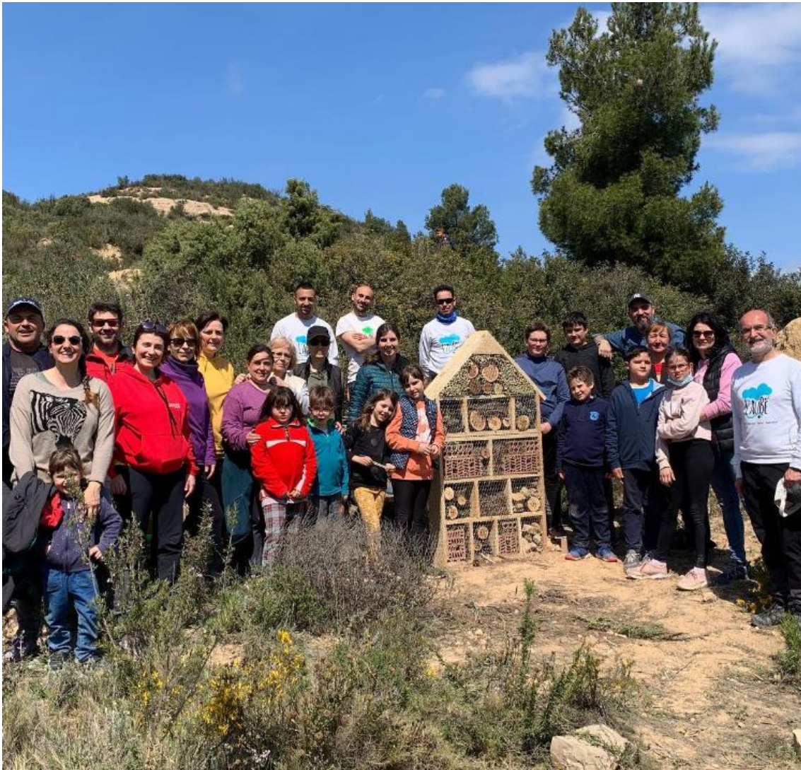
Imatge 7. Construcció d'un hotel d'insectes a la Poble de Massaluca.