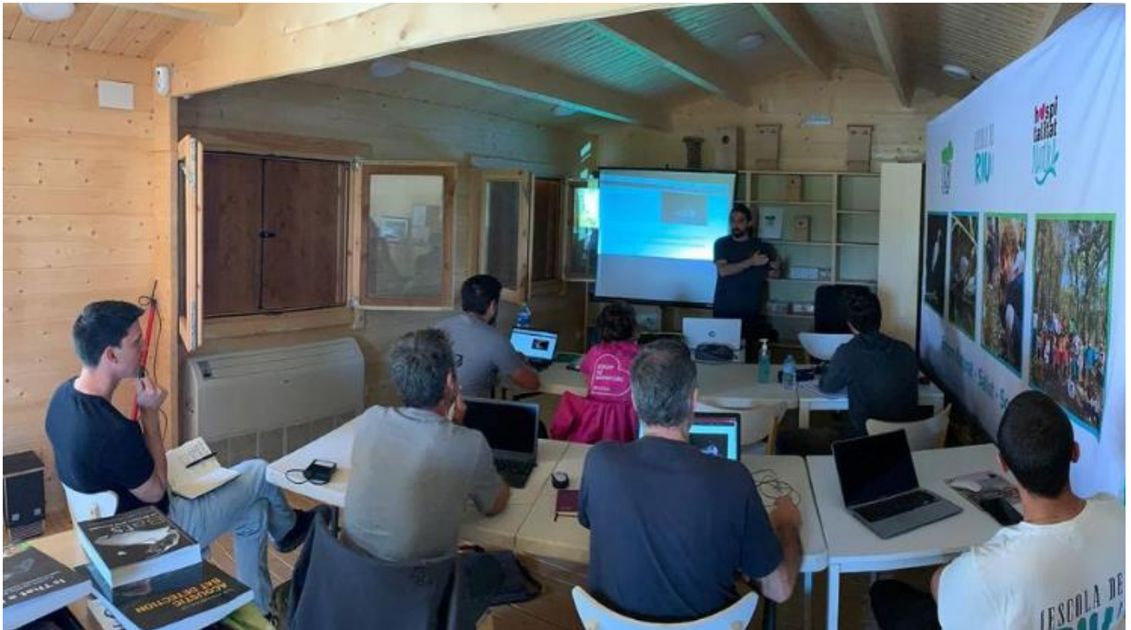
Imatge 4. Jornada de formació per al seguiment de ratpenats a la seu de l'Aube.