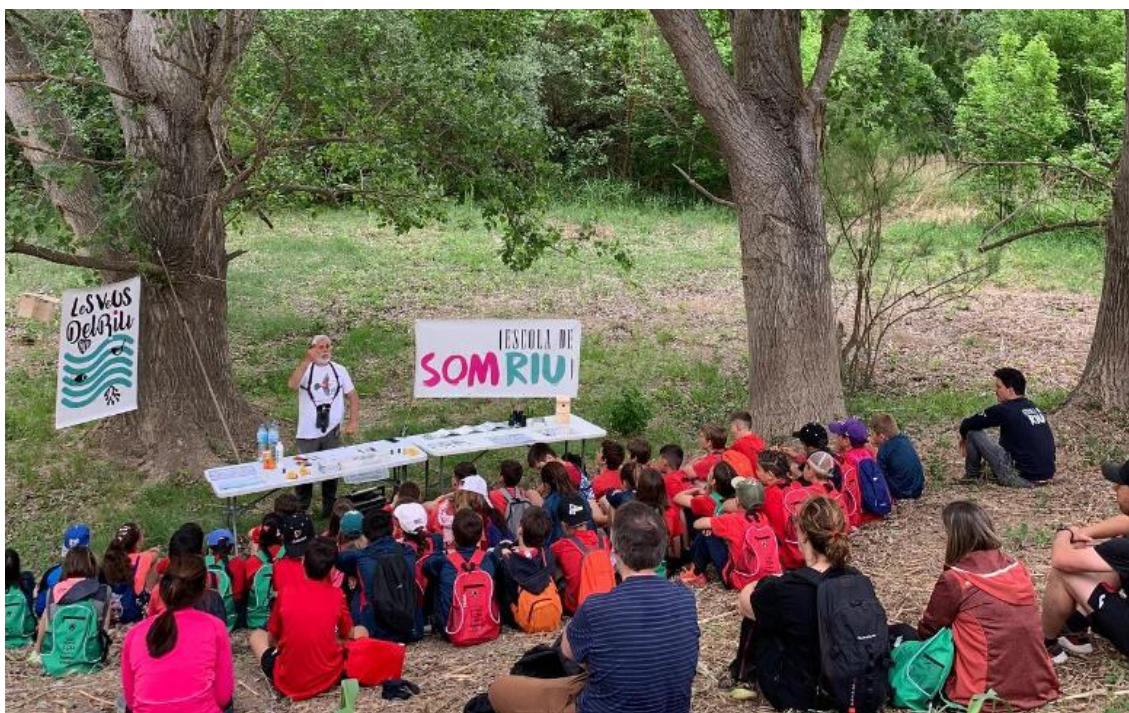
Imatge 3. Jornada d'anellament científic a Miravet.