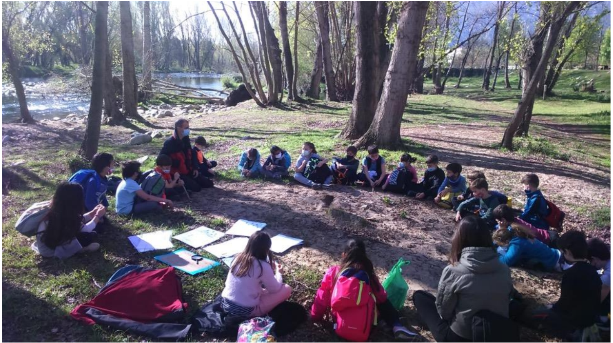
Imatge 4. Activitat d'educació ambiental a les Ribes del Ter.