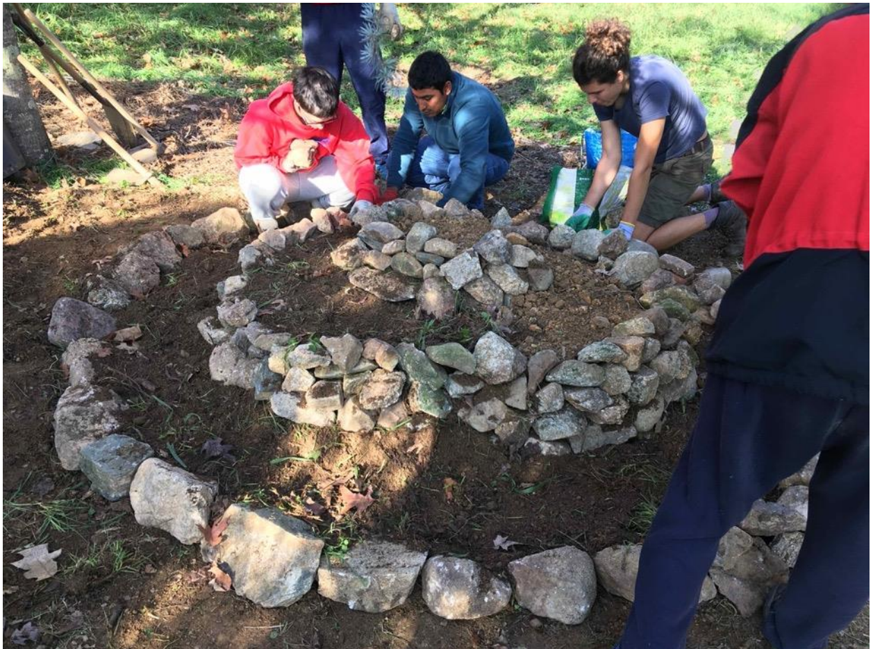
Imatge 6. WWOOFers construint una espiral d'aromàtiques (El Meandre).

El voluntariat consisteix en 4 hores de feina diaris per un període curt, normalment entre 3-5 setmanes. Hi ha dos subprojectes dintre d'aquesta proposta (Veure Annexes 3 i 4), tot i que es demana treballar en el que sigui necessari en cada moment. No obstant això intentem adaptar-nos al màxim als interessos dels WWOOFers.