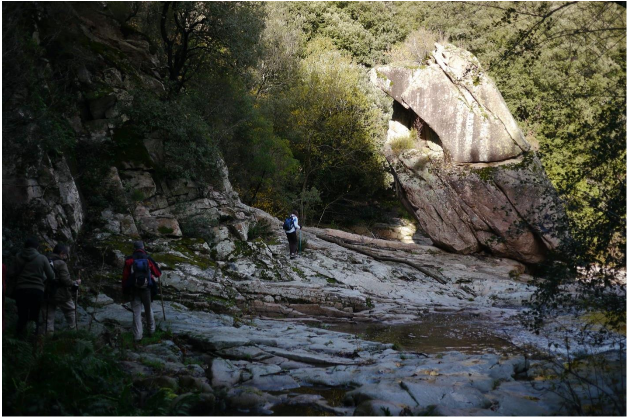
Imatge 3. Excursió a la Roca Foradada, les Guilleries (Annika Hollmichel).