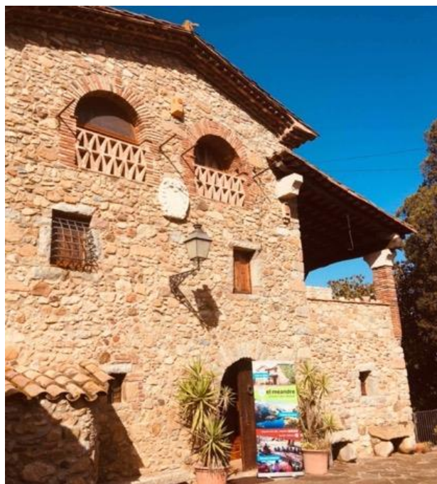
Imatge 2. Masia de Can Busquetics, seu de l'Aula de Natura (El Meandre).

A l'Aula de Natura disposem de: un aula física per poder fer tallers i presentacions audiovisuals (amb lavabo i adaptada per cadires de rodes); tot un seguit d'ecosistemes demostratius (basses per amfibis, bosquet mediterrani, prat de dall, etc.) i infraestructures per la fauna (menjadora d'ocells i aguait, caixes-niu d'ocells i caixes-refugi de ratpenats, jardí de papallones, hotel d'insectes, etc). Per altra banda, hi ha diversos espais, com un hort experimental didàctic i un bosc comestible per tractar temes com l'agricultura natural, la permacultura (com a eines per augmentar la fertilitat del sòl, la captura de carboni i millorar la biodiversitat en els sistemes agrícoles), l'agricultura de secà (en relació al canvi climàtic i la sequera crònica) i l'etnobotànica (es tracta d'un bosc comestible temàtic, on les plantes estan agrupades pels seus usos). Finalment, inclou una zona d'esbarjo i joc lliure.