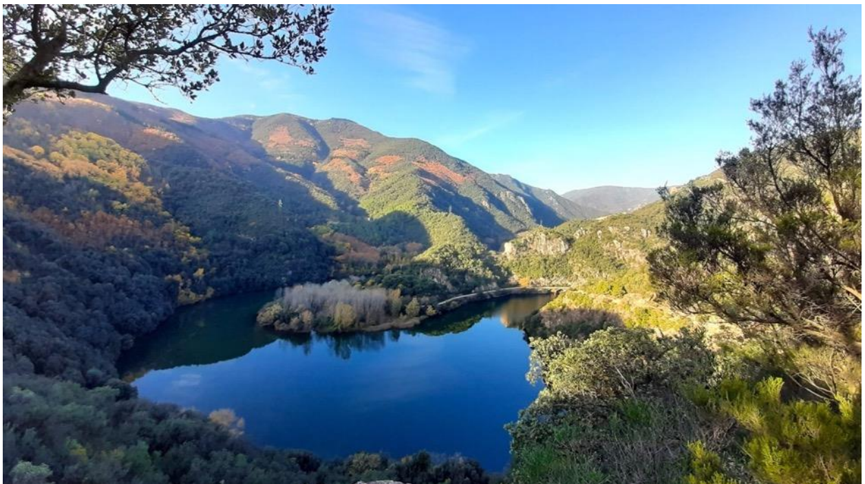
Imatge 1. Congost semblant a un meandre que forma el pantà del Pasteral (Kees Hogenboom).

Al sector de muntanya predominen els alzinars, castanyedes i suredes. Entre la fauna d'aquestes muntanyes destaca la important població de ratpenats a la cova del Pasteral. També cal mencionar la presència de la falguera Pellaea hastata , que al planeta només la trobem al sud d'Àfrica i alguns punts d'Àsia.