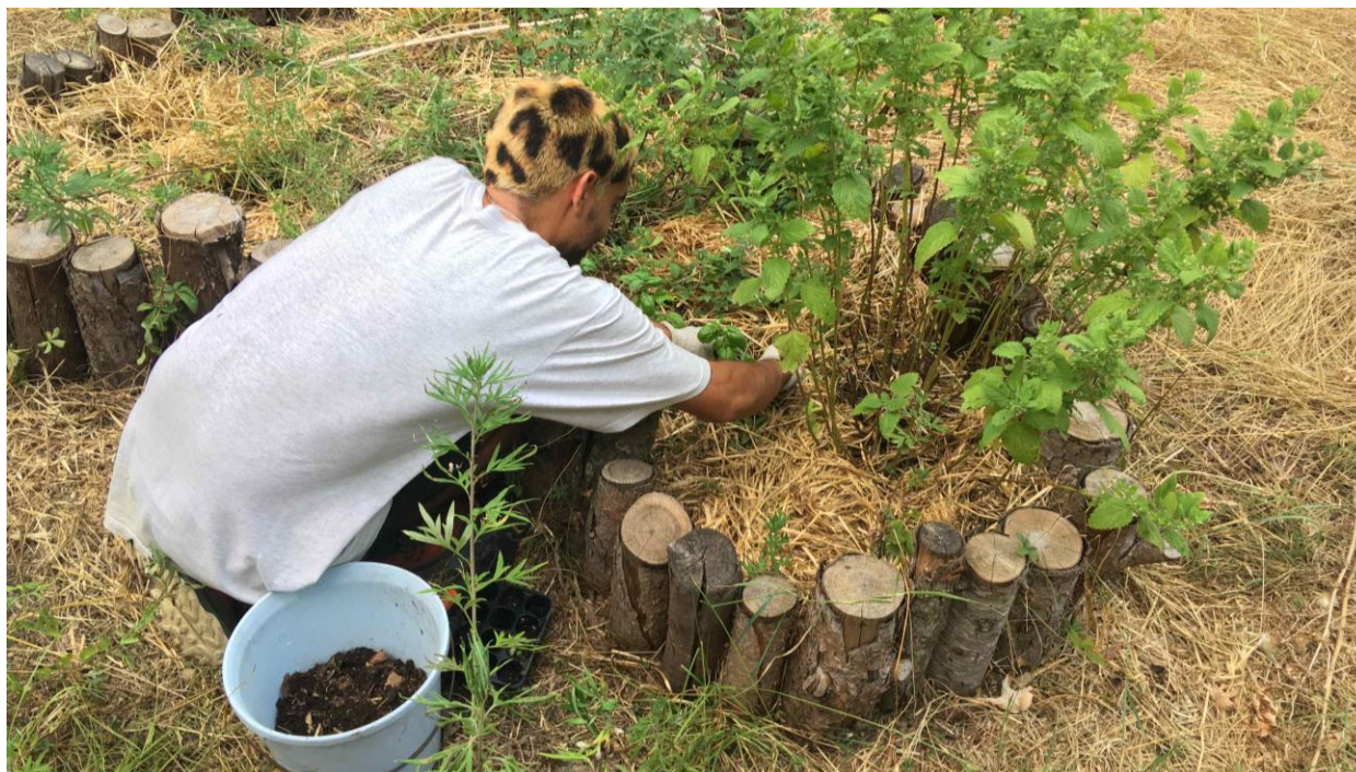
Imatge 8. WWOOFer treballant al jardí de papallones (El Meandre).

Per a la comunicació interna, és pot fer un grup de WhatsApp o semblant, el qual es pot mantenir si hi ha la voluntat dels voluntaris de continuar informats d'activitats futures.