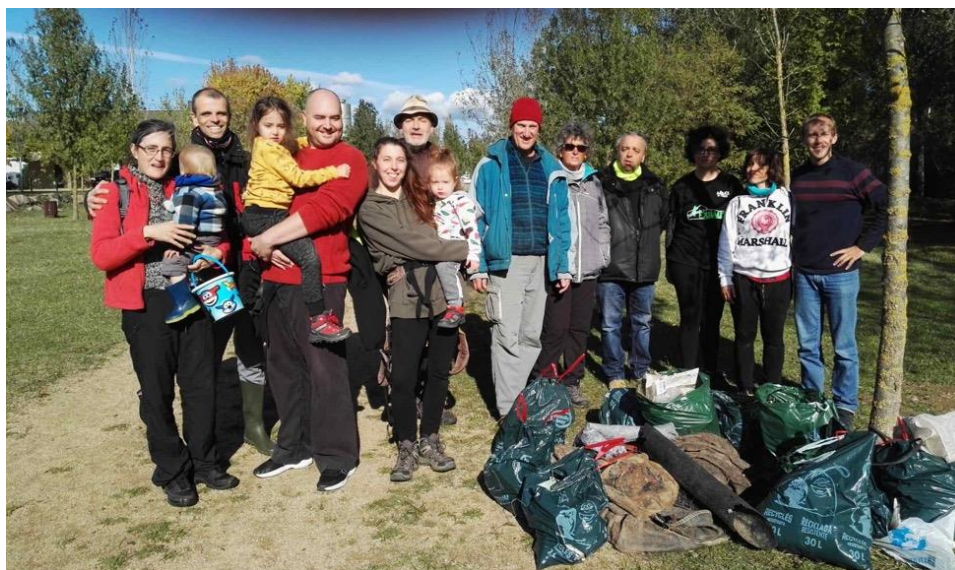
Imatge 7. Jornada de neteja Clean up the Med a les Ribes del Ter (El Meandre).

Per aquest voluntariat no demanem la pertinença a cap municipi concret, però si viure a prop (o estiuajar) per augmentar la possibilitat d'apuntar-se a les activitats i esdevenir un grup estable.