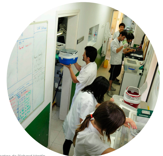
Imatge de Richard Martín.

Escriu a l'entitat de voluntariat del centre de fauna on vols participar i t'inclourem a la borsa de voluntariat. En cas que hi hagi vacants o torns sense omplir, ens posarem en contacte amb tu.